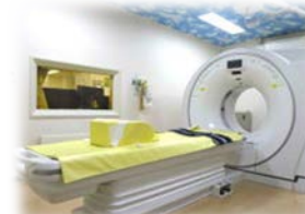
64列マルチスライスCT