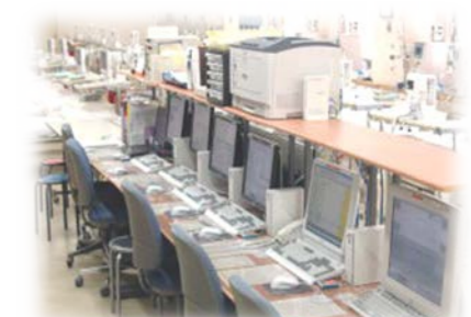
透析情報管理システム

各ベッドには液晶テレビ(地上・BS)・ナースコールを設置しています。室内中央にスタッフテーブルを配置し、室内の隅々まで目が行き届くよう配慮し、患者様が安心して治療を受けられるような環境作りに努めています。