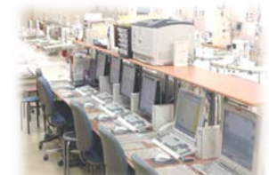
透析情報管理システム

各ベッドには液晶テレビ(地上・BS)・ナースコールを設置しています。室内中央にスタッフテーブルを配置し、室内の隅々まで目が行き届くよう配慮し、患者様が安心して治療を受けられるような環境作りに努めています。