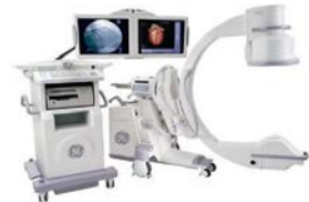
外科用X線撮影装置(Cアーム)