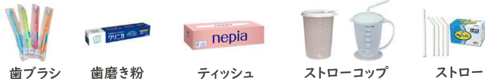
歯ブラシ 歯磨き粉 ティッシュ ストローコップ ストロー