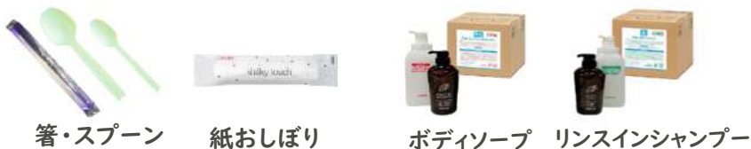
箸・スプーン 紙おしぼり ボディソープ リンスインシャンプー ※浴室備え付け商品